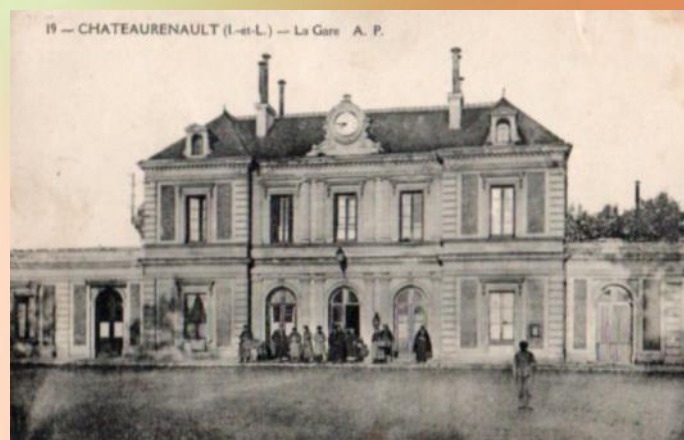
Gare de Château Renault