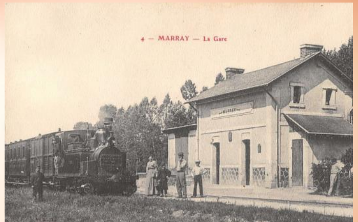
Gare de Marray