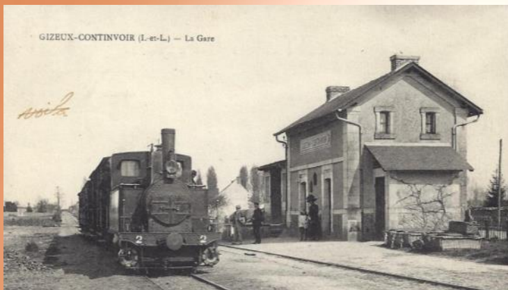
Gare de Gizeux-Continvoir

Sur les cartes, machine MALLET Compound, type 020, construite de 1893 à 1920 par la SACM à Belfort... utilisée pour les compagnies des Chemins de Fer Départementaux .