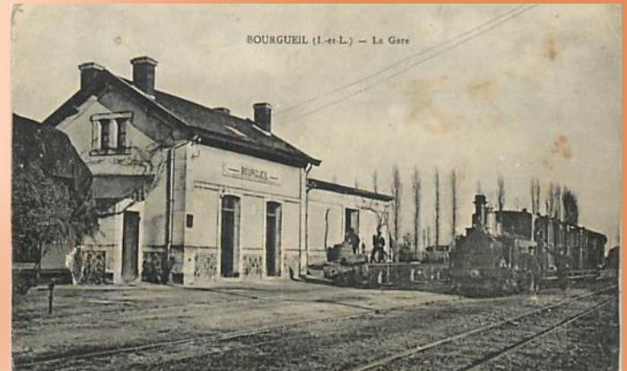
Gare de Bourgueil

Sur les cartes, machine MALLET Compound, type 020, construite de 1893 à 1920 par la SACM à Belfort... utilisée pour les compagnies des Chemins de Fer Départementaux .