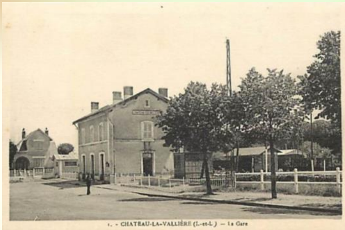
Gare de Château-la-Vallière