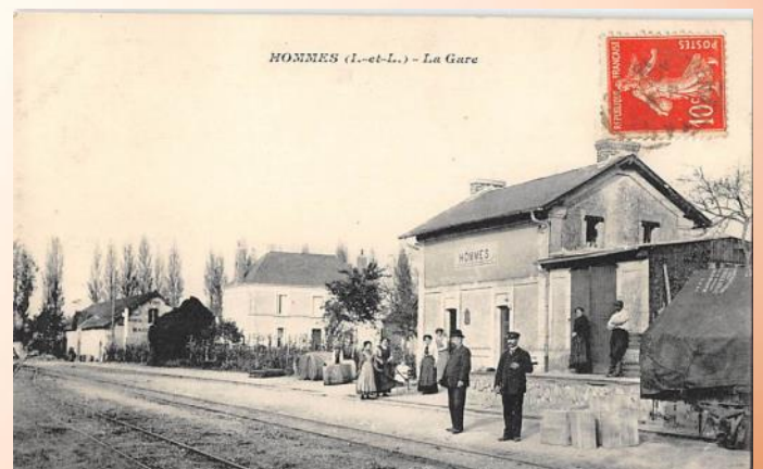
Gare de Hommes