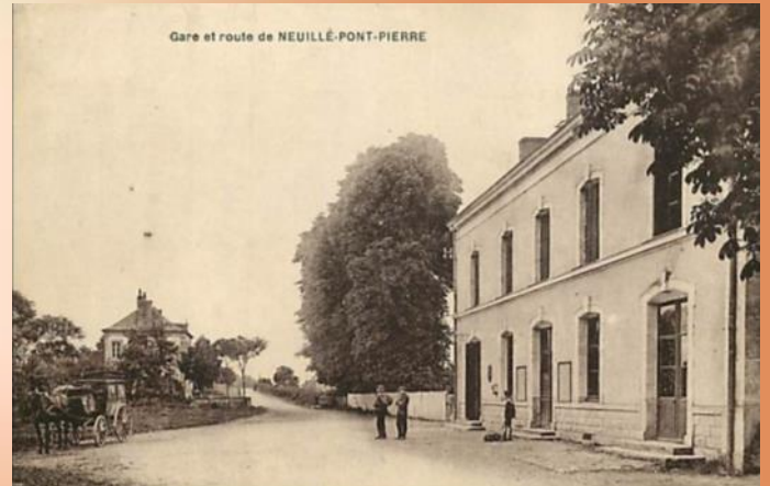
Gare de Neuillé-Pont-Pierre