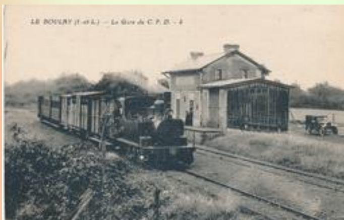
Gare de Le Boulay