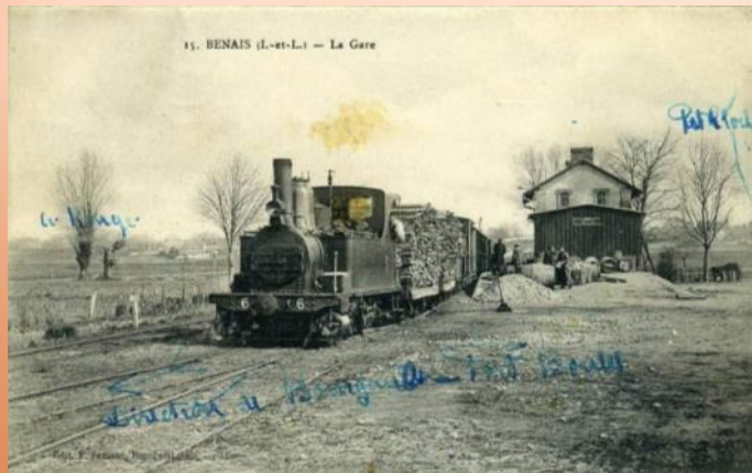
Gare de Benais