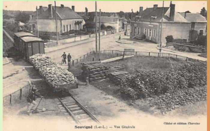
Gare de Souvigné