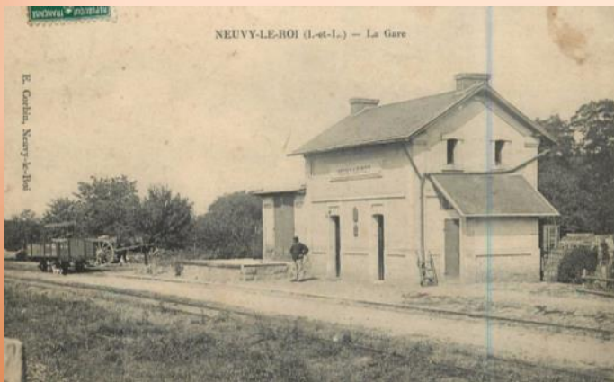
Gare de Neuvy le Roi