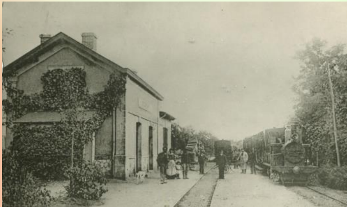
Gare de Sonzay