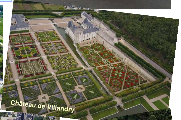
Château de Villandry