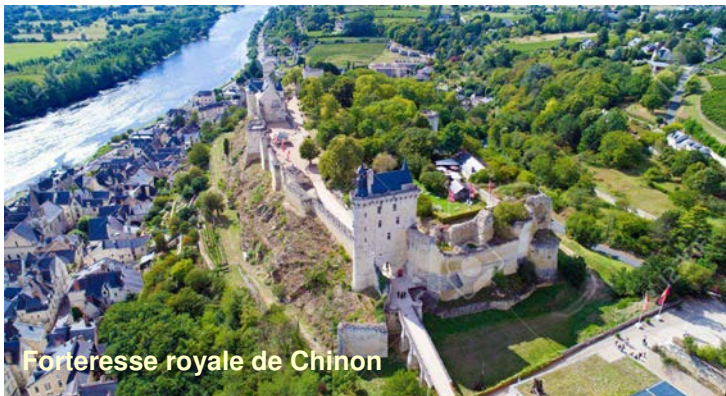
Forteresse royale de Chinon