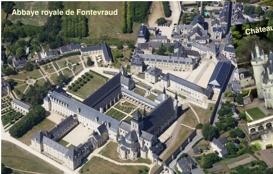
Abbaye royale de Fontevraud